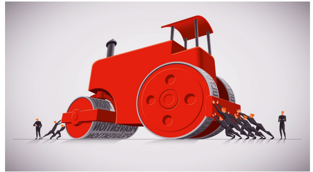
Kräfte bündeln! Ist der Koloss in Bewegung, wird es schwer, ihn aufzuhalten

Es wird nicht gelingen, alle Risiken dieser Welt zu beseitigen. Aber sie, soweit sie vorausgesehen oder erahnt werden können, zu beherrschen, gehört immer zu den notwendigen Kompetenzen. Die Identifizierung möglicher Risiken durch alle Kollegen, Abteilungen und Funktionen im Unternehmen und deren professionelle Bewältigung macht ein Unternehmen mit seinen Produkten zu einem führenden Unternehmen.