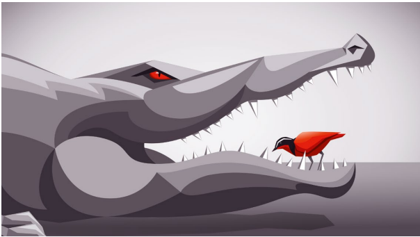
Der Krokodilputzer als Symbiose von Abhängigkeit und Vertrauen zwischen Groß und Klein

Es wird nicht gelingen, alle Risiken dieser Welt zu beseitigen. Aber sie, soweit sie vorausgesehen oder erahnt werden können, zu beherrschen, gehört immer zu den notwendigen Kompetenzen. Die Identifizierung möglicher Risiken durch alle Kollegen, Abteilungen und Funktionen im Unternehmen und deren professionelle Bewältigung macht ein Unternehmen mit seinen Produkten zu einem führenden Unternehmen.